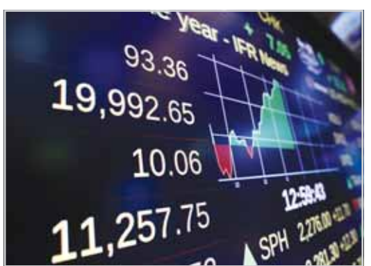
استقرار أداء البورصات العالمية

السعودي أسوأ أداء يليه مؤشر السوق الكوئيتي، بينما كان مؤشر سوق دبي المالي الأفضل أداءً. انخفض مؤشر تداول للأسهم السعودية بنسبة -8,27% خلال الربع، بمساهمة سلبية من قطاع الإعلام بنسبة -14,34% وقطاع البنوك بنسبة -13,35% وقطاع المواد بنسبة -10,07%. انخفض مؤشر سوق الكويت للأوراق المالية بنسبة -2,61% خلال الربع، بمساهمة سلبية من قطاع التكنولوجيا بنسبة -16,96% وقطاع المواد الأساسية بنسبة -11,96%. انخفض مؤشر سوق قطر بنسبة -1,44% خلال الربع، بمساهمة سلبية من قطاع التأمين بنسبة -4,22% وقطاع الصناعة بنسبة -3,97% وقطاع العقار بنسبة -3,87%. في الإمارات العربية المتحدة، ارتفع مؤشر سوق دبي المالي بنسبة +4,61% خلال الربع، بمساهمة إيجابية من قطاع التأمين بنسبة +13,57% وقطاع الاتصالات بنسبة +8,93%. في أبوظبي، ارتفع مؤشر سوق أبوظبي للأوراق المالية بنسبة +1,55% خلال الربع، بمساهمة إيجابية من قطاع السلع الاستهلاكية بنسبة +100,13% وقطاع العقار بنسبة +10,16%. في عمان، ارتفع مؤشر السوق بنسبة +3,42% خلال الربع، بمساهمة إيجابية من قطاع البنوك بنسبة +4,36%. في البحرين، ارتفع مؤشر سوق البحرين للأوراق المالية بنسبة +3,09% خلال الربع، بمساهمة إيجابية من قطاع البنوك بنسبة +4,65%.